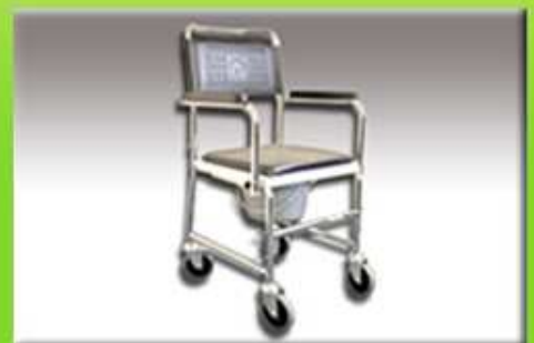
Křeslo klozetové (pojízdné)