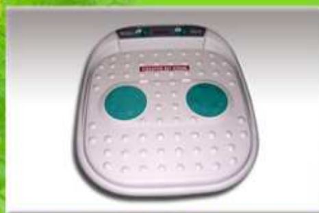
Masážní přístroj (na nohy)