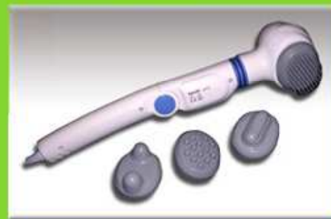
Ruční masážní přístroj (na celé tělo)