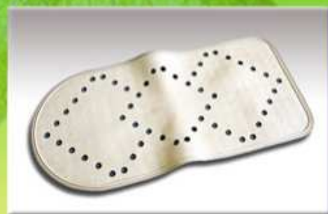
Protiskluzová sedačka do vany