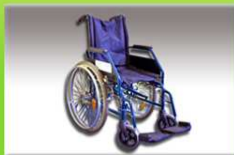
Invalidní vozík mechanický (skládací)