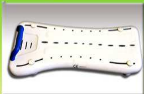
Sedačka na vanu (rovná)