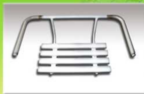
Sedačka do vany (s opěrkou)