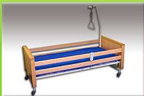
Elektrické polohovací lůžko včetně matrace

Skladové prostory a kancelář výdeje: Sokolovská č.p. 1997 (budova domova pro seniory)