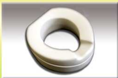
Nástavec na WC