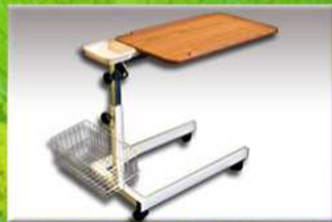
Polohovací stolek k lůžku (krmík)