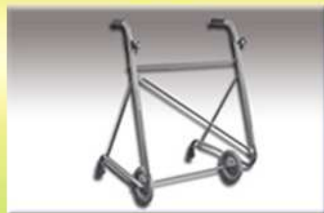
Chodítko dvoukolové (výškově nastavitelné)